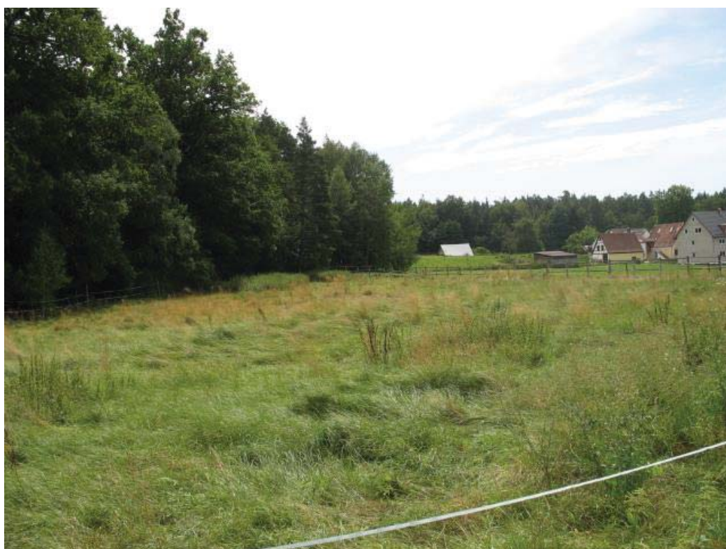
Abb. 5: TFL 371.03 LRT 6510 Nr. 25 Brache