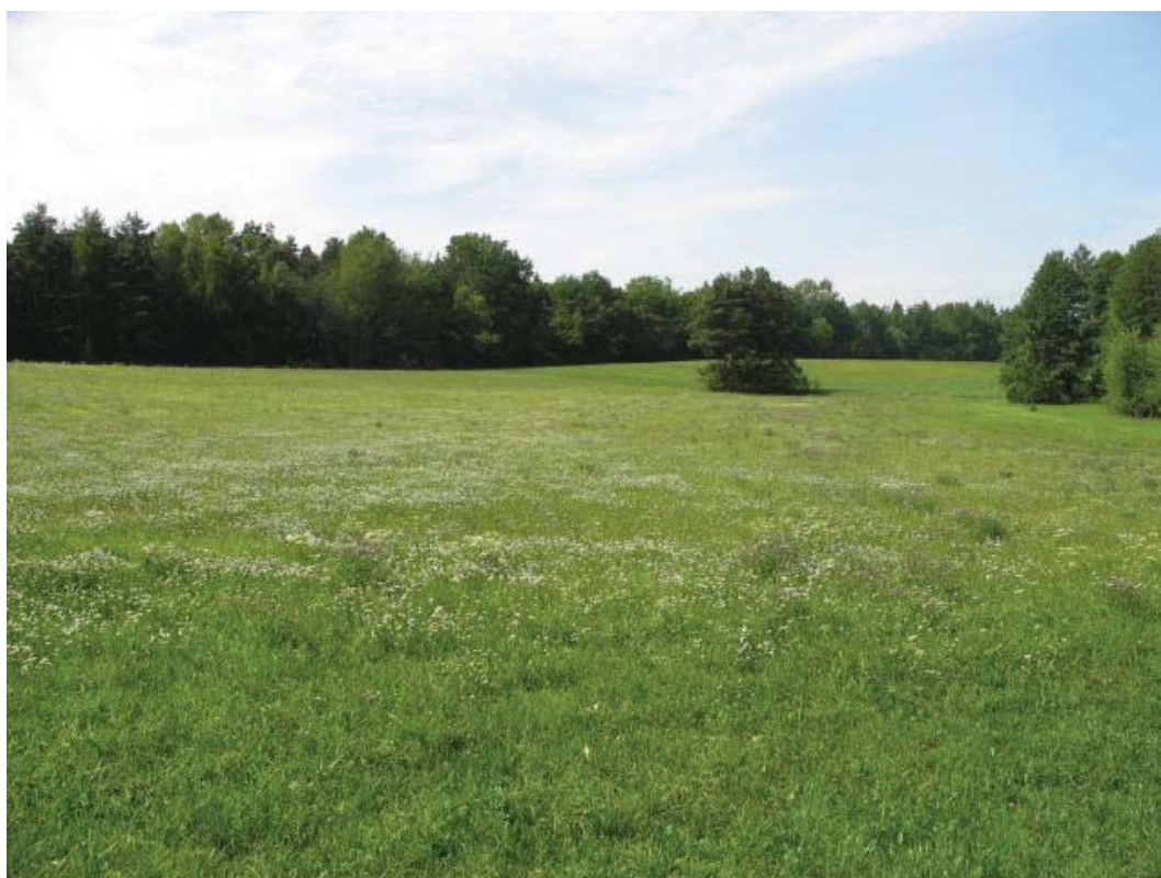
Abb. 13: TFL 371.03 LRT 6510 Nr. 21