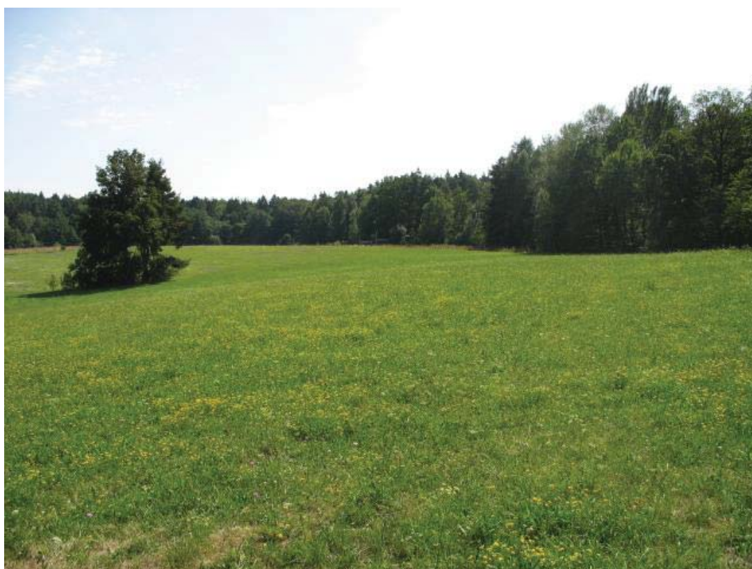
Abb. 9: TFL 371.03 LRT 6510 Nr. 20