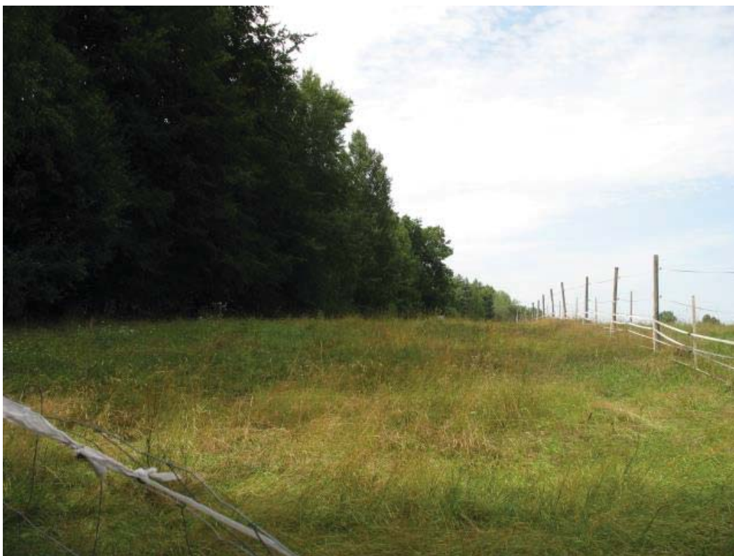
Abb. 15: TFL 371.03 LRT 6510 Nr. 23 (südlicher Bereich)