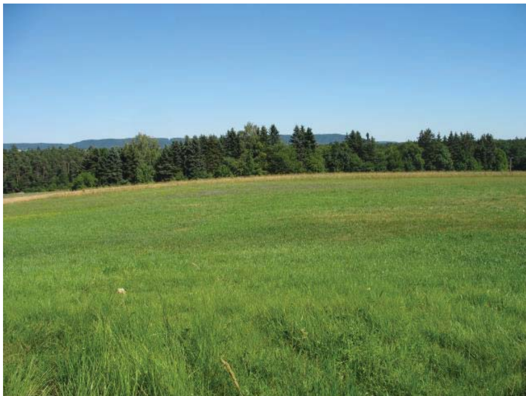
Abb. 4: TFL 371.01 LRT 6510 Nr. 01