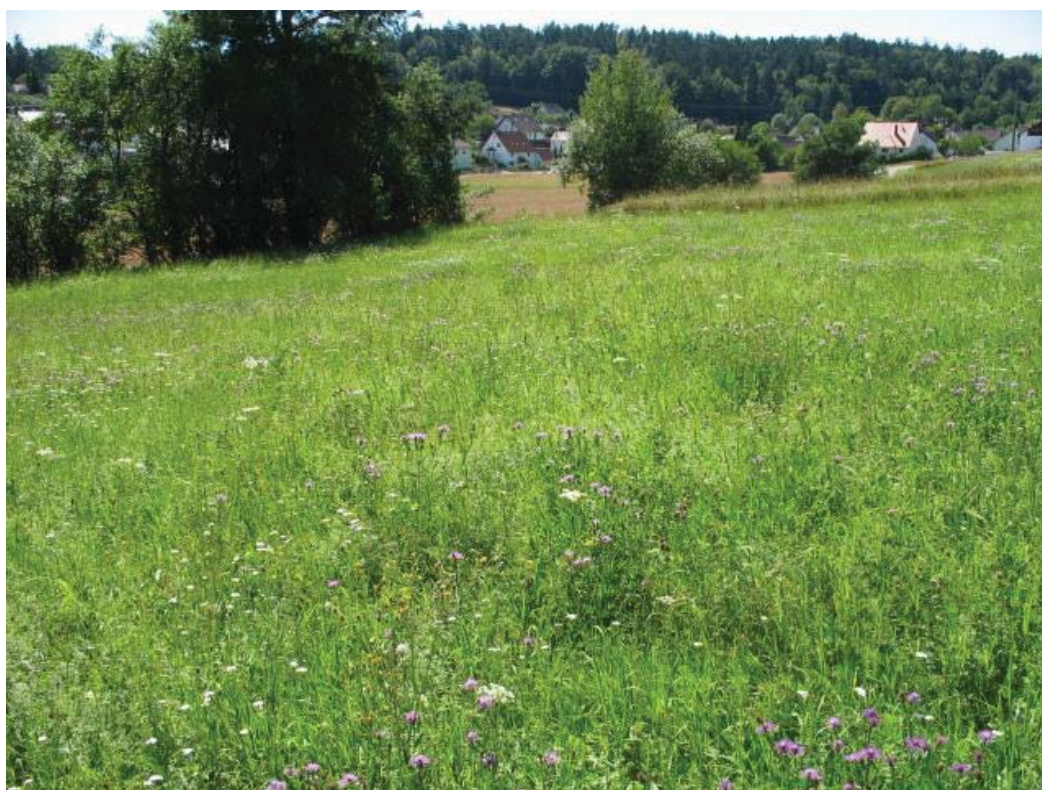
Abb. 3: TFL 371.01 LRT 6510 Nr. 08