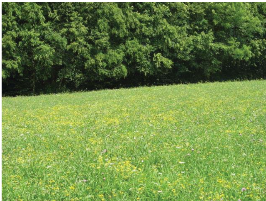
Abb. 8: TFL 371.03 LRT 6510 Nr. 27