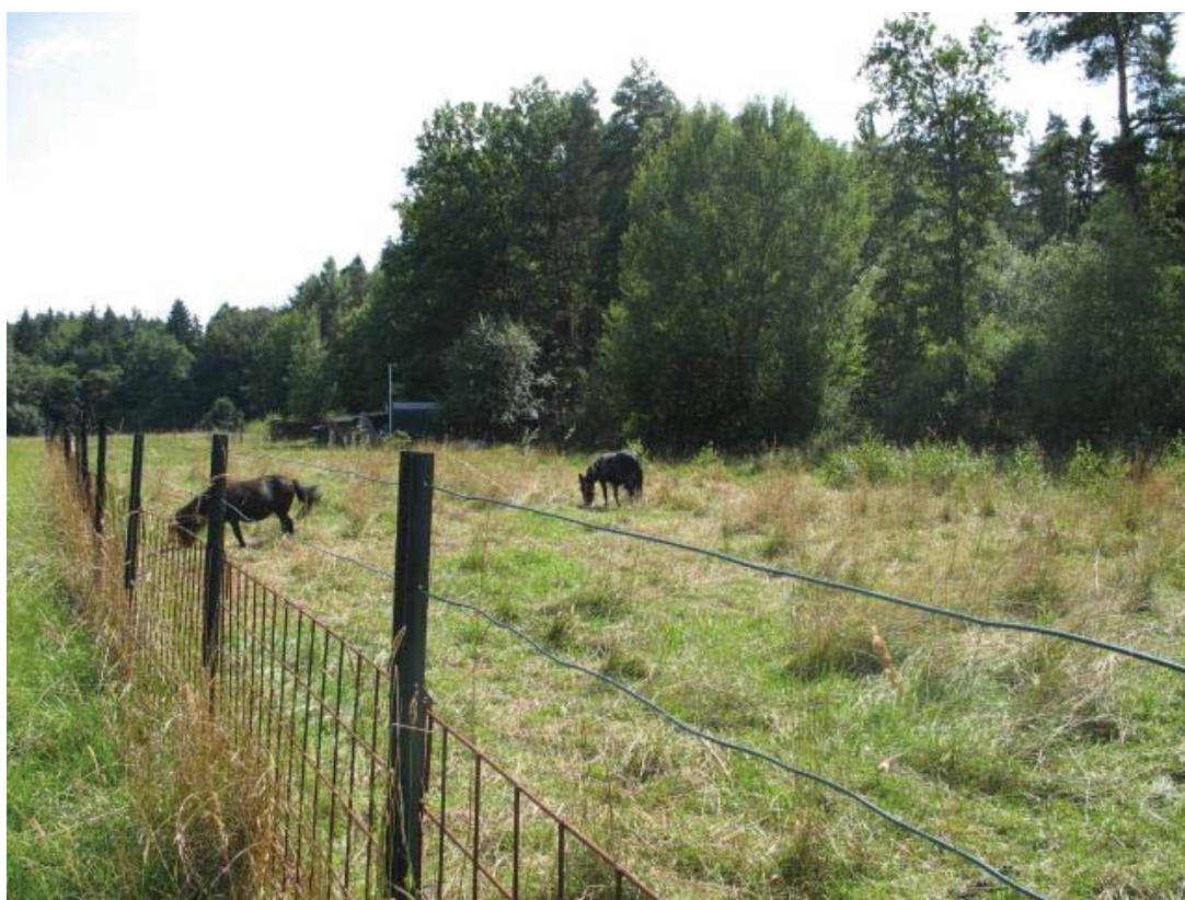
Abb. 11: TFL 371.03 LRT 6510 Nr. 23