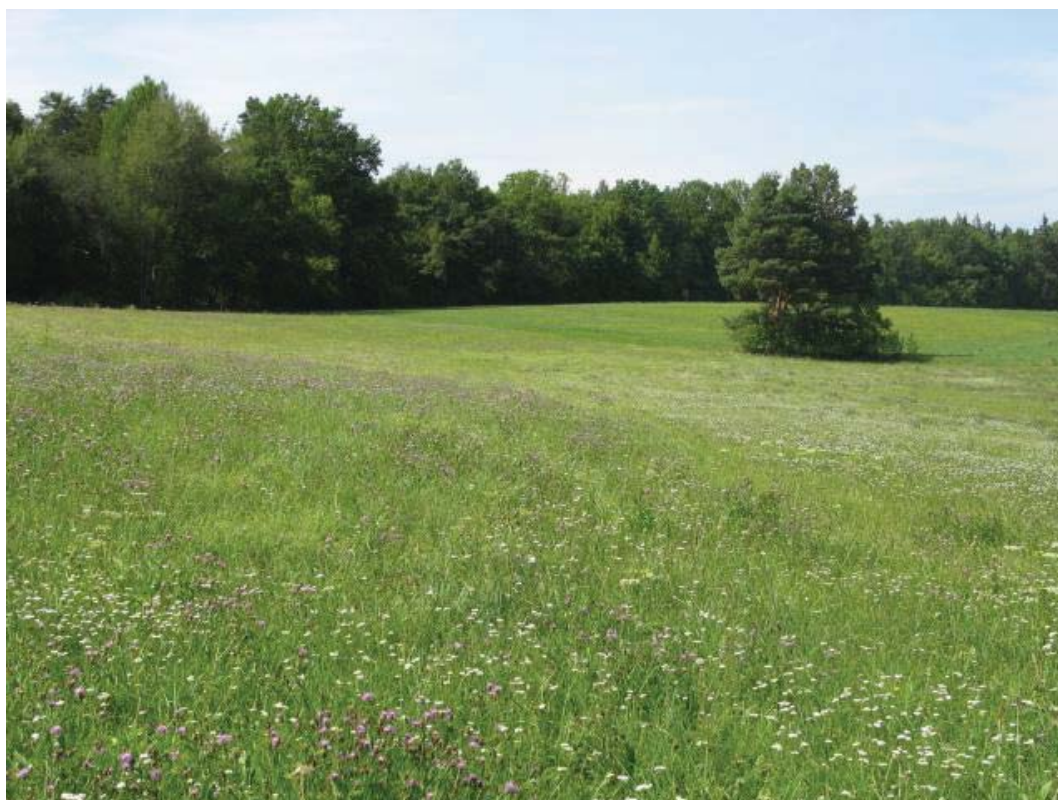
Abb. 12: TFL 371.03 LRT 6510 Nr. 22 (im Vordergrund) und Nr. 21