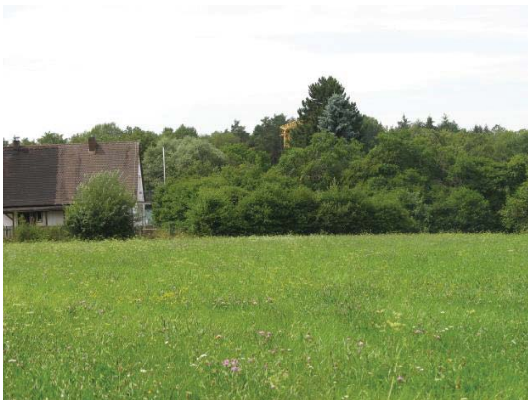
Abb. 7: TFL 371.03 LRT 6510 Nr. 26