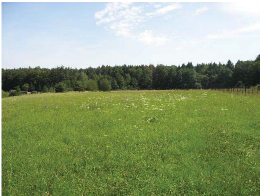
Abb. 10: TFL 371.03 LRT 6510 Nr. 22