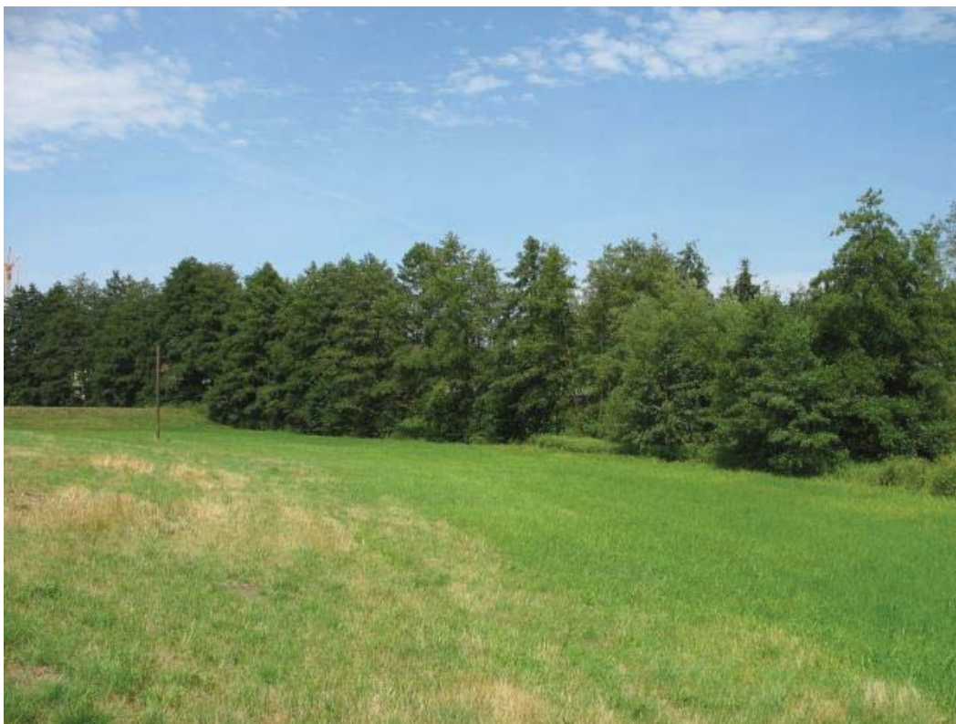
Abb. 14: TFL 371.03 LRT 91E0 Nr. 33 im Hintergrund