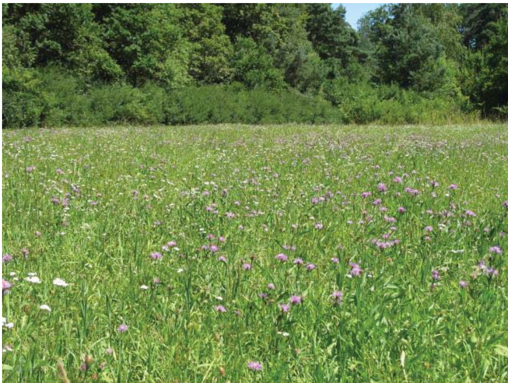
Abb. 1: TFL 371.01 LRT 6510 Nr. 06