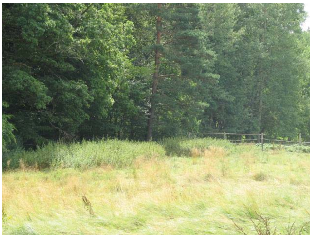
Abb. 6: TFL 371.03 LRT 6510 Nr. 25 mit ausgegrenzten Bereichen am Waldrand